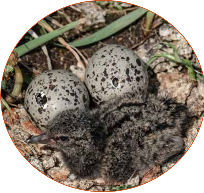
Ostrero negro norteamericano

La mayoría de las aves playeras anidan en el suelo. Cavan pequeñas ranuras en la arena, barro o rocas para poner sus huevos. Los huevos son moteados, lo que les resulta útil para esconderse (camuflaje) de los depredadores. Describe los diferentes tipos de huevos y nidos.