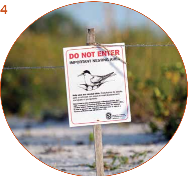
marcar zonas de anidado para alertar a las personas con miras a que se alejen del lugar

Respuestas: 1: herir; 2: ayudar; 3: herir; 4: ayudar