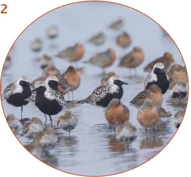
santuarios de aves