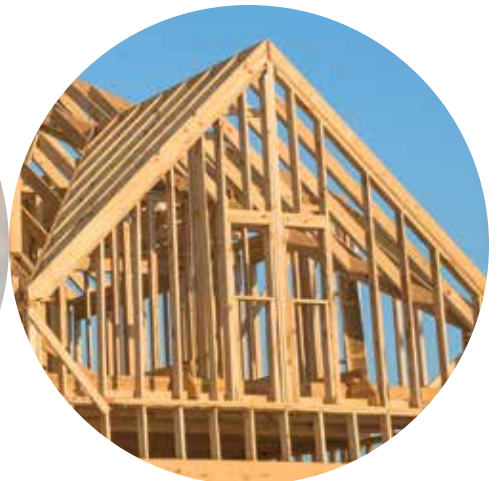
leño de madera

Respuestas: Renovables: vegetales, bloques de madera, nuggets de pollo, neumáticos de goma, leño de madera. No renovables: peldaños de piedra, anillo de diamante, baldosas de piedra, latas de aluminio (reciclables)