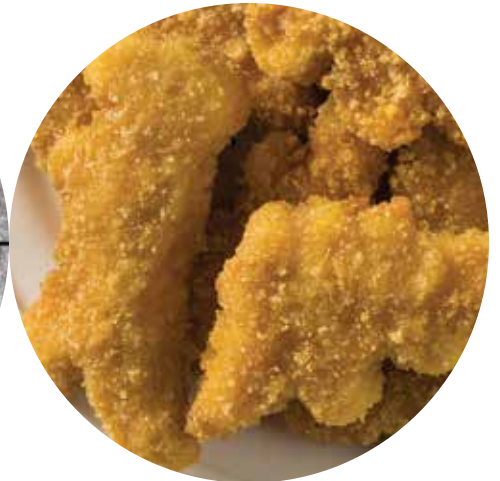
nuggets de pollo