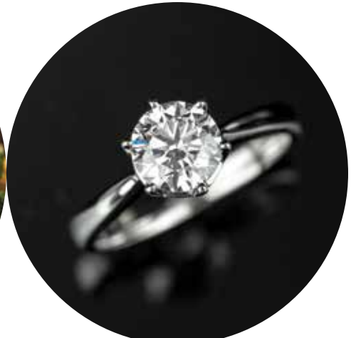
anillo de diamante