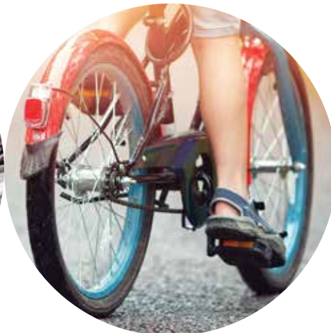
neumático de goma