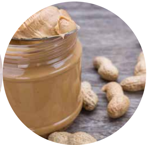
mantequilla de maní