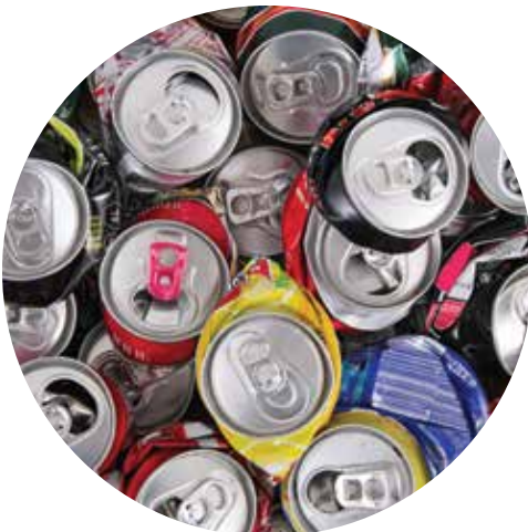
latas de aluminio