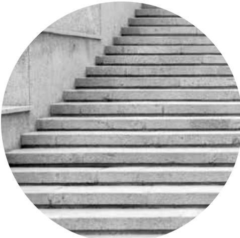
escaleras de piedra