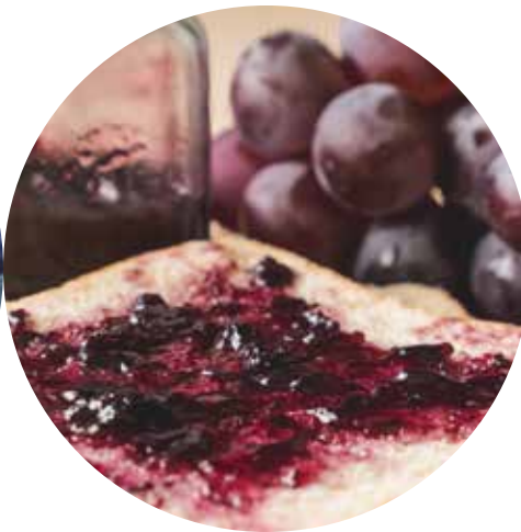
mermelada de uva