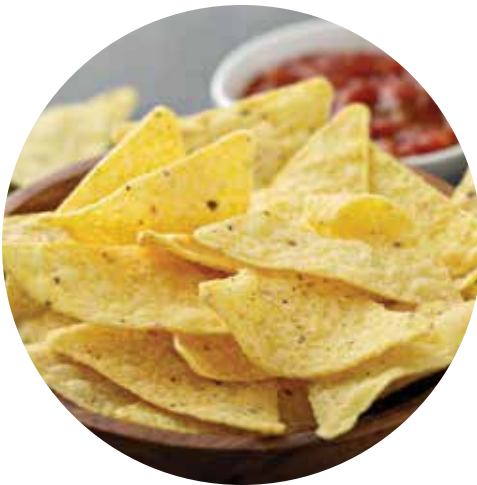
tortillas de maíz

¿Puedes identificar cuál de las siguientes cosas provienen de recursos renovables y no renovables? Discute con un amigo o un adulto acerca de cuáles recursos fueron usados y cómo obtenerlos.