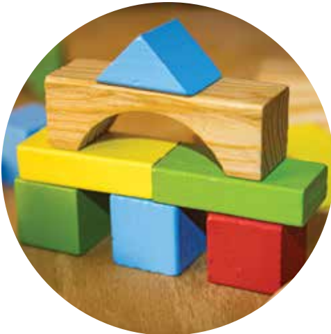
bloques de madera