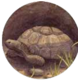
tortugas del desierto